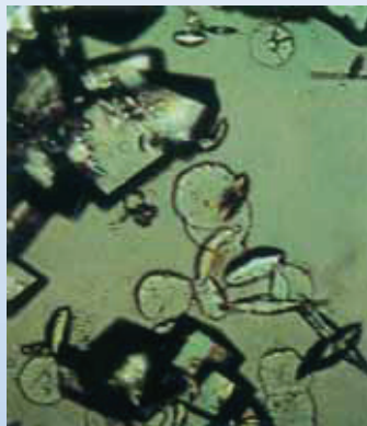
Kalcijevi kristali v neobdelani vodi se bodo oprigli sten cevi in naprav

Za razliko od kemičnih postopkov mehčanja, iz vode ne odstranimo kalcija in magnezija, temveč dosežemo, da minerali okrog namagnetnenih jeder, skupaj z vodo potujejo naprej in se ne oprimejo na instalacije in naprave. S cevi odstranijo do 30% že nastalih oblog.