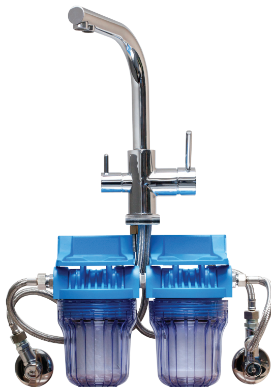
FILTRACIJSKI SISTEM AQUAVALLIS S POSEBNO DVOIZLIVNO PIPO.

100% zaščita pred virusi, bakterijami in težkimi kovinami